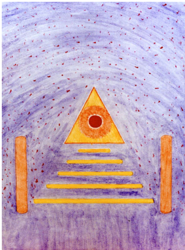
Путь в вечность