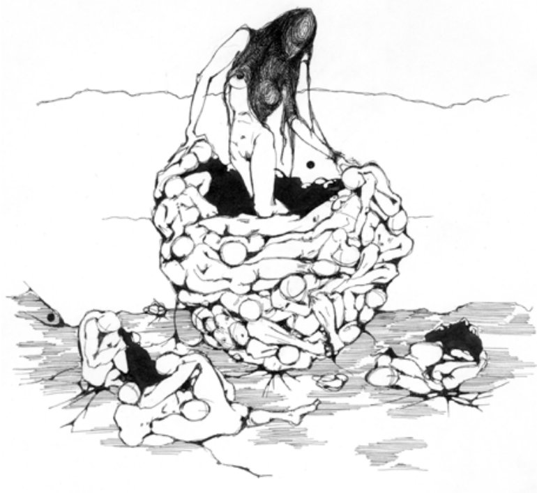
(Т. Сенчанка «Ақраджәнне»)