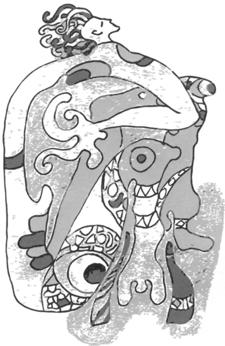
(D. Канграцевей «Пворца»)